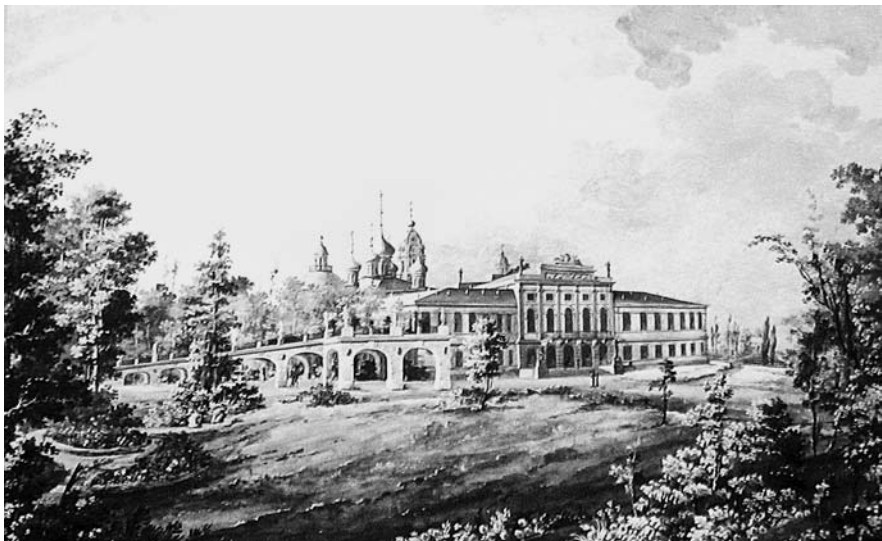
К. И. Росси. Вид Путевого дворца в Твери. Северный фасад. 1800-е. Х., м. ТГОМ

доступ в примечательные места такого рода, как у нас в Петербурге. Для того чтобы получить позволение осмотреть дворец, нам надобно бы прождать у стен его, может быть, около часу, а мы дорожили каждой минутой времени; и так надобно было удовольствоваться только садом, принадлежащим ко дворцу. Он довольно велик и богат тенистыми деревьями. В разные стороны есть прекрасные виды на окрестности и особенно на Волгу, протекающую у самого сада. Но мы все решили, что грустно чувствовать пустоту в тех местах, где еще так недавно в сравнении с другими местами, виденными нами по этой дороге, было всё живо и радостно. При этом случае я не могла не подивиться, как глубока бездна прошедшего. Как быстро скрывается в ней всё, что поглощает она, и как незаметно и самые свежие жертвы принимают в ней один образ с теми, которые уже давно, давно лежали на мрачном дне. Не чудно ли, что и великая княгиня Екатерина Павловна, которой прелесть еще памятна для многих, живущих ныне, и император Александр, о котором вся Европа еще говорит как о своем недавнем спасителе, и, наконец, Карамзин, еще, можно сказать, живущий среди нас красноречивыми страницами своей истории, что все они — еще так недавно живые и современные нам — в неумолимом прошедшем стоят в такой же дали от нас, как и те, которые расстались с землею за несколько столетий прежде них! Отчего там, в этой непостижимой вечности, — нет близости для близких к нам? Я часто думаю об этом,